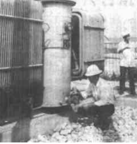
变电处人员克服困难,安全完成输电任务。截至今日,变电处已安全运行2天,累计实现供电量500万千瓦时,为盐垦生产、生活提供了可靠的电力保障。

理一片、收效一片”的原则,大搞中低产田改造,经过8个冬春的努力,使全村5000亩农田基本实现了排灌配套。与此同时,他们根据果树耐旱,适宜沙质土壤栽植的特点,把发展林果业作为农民脱贫致富的突破口来抓,边开发边栽树,先后建成果园1500亩,人均1亩多,建成枣园660亩,枣园间作1500亩,育苗苗100亩,为提高经济效益和生态效益奠定了基础。现已有700亩果园相继进入盛果期,年产优质果品50多万公斤,仅林果一项可年创产值100多万元。他们种植的新红星、乔纳金、红富士等5个品种多次被评为市优果品,并远销上海、广州、北京、福建等大中城市。林果生产已成为老鸦村的支柱产业。